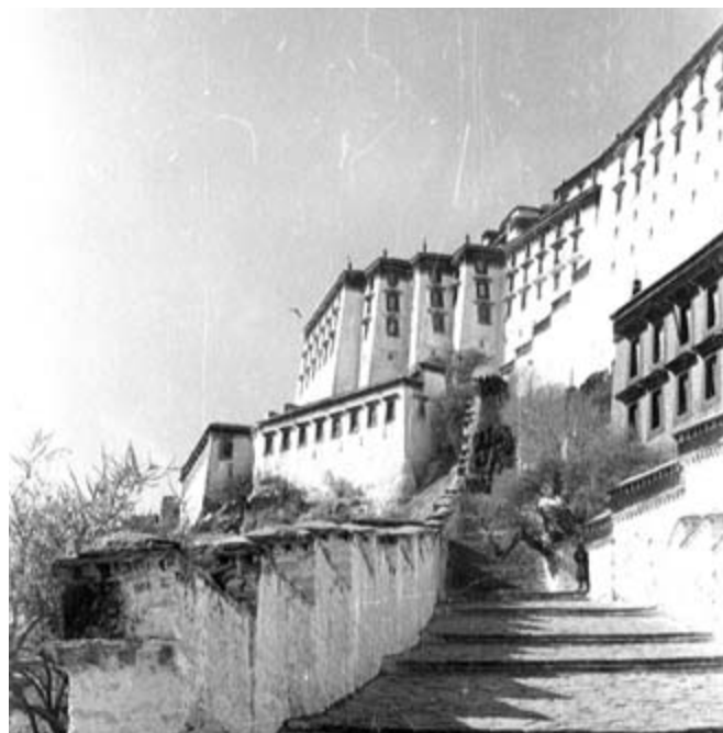
Potala - sídlo Dalajlámy v Lhasě